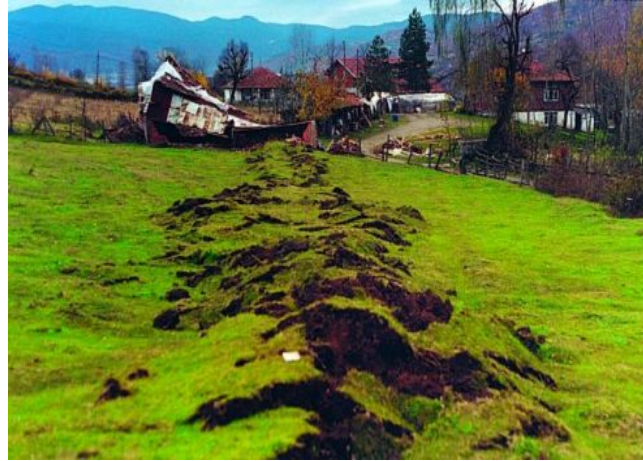
12 Kasım 1999 Düzce depremi yüzey kırığı